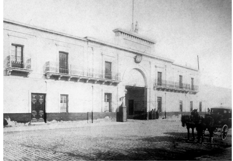
Entrada al Parque de Artillería ubicado frente a la Plaza Lavalle,

Efímera fue esta asonada. Tan solo tres días duró, pero el gobierno se hallaba minado en su interior debido a discrepancias internas. El astuto Roca comenzó a operar y las renunciaciones en el gabinete comenzaron a sucederse. Por último, Juárez Celman renunciaba el 6 de agosto, siendo reemplazado por su vice, Carlos Pellegrini.