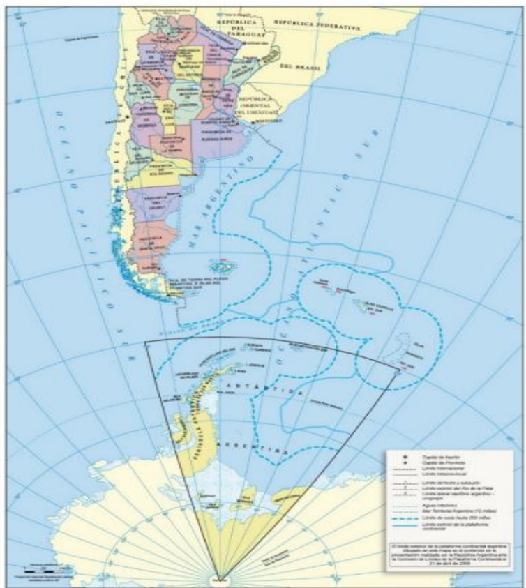
Somos un País Continental, Insular, Marítimo y Antártico

Oligárquico, Liberal, Financiero, Agro exportador, de Saqueo de Recursos Naturales y de Exclusión Social, subordinado a un Mundo Unipolar